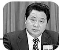
倪发科 安徽省原副省长