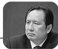
张曙光 原铁道部运输局局长

我偏偏痴迷上了玉石玉器,让所谓的玉文化的这种糖衣的“雅贿”迷住了双眼,让疯狂的石头,把我绊倒,摔下万丈深渊,走向人生的不归路。 未宣判