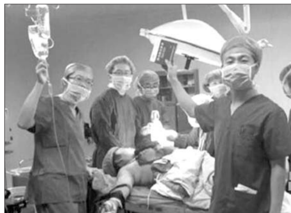
被罚医生上传的自拍照。