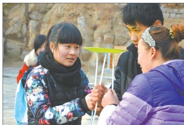
心静如水,合力顶盘子。