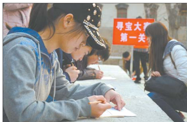
小时候会的数独,现在成了难题。