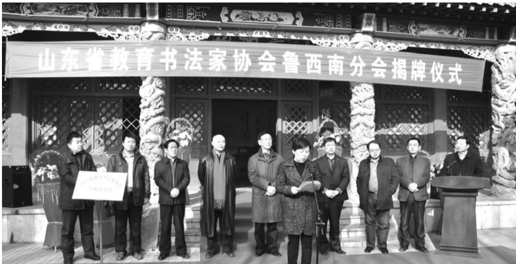
山东省教育书法家协会鲁西南分会成立照片