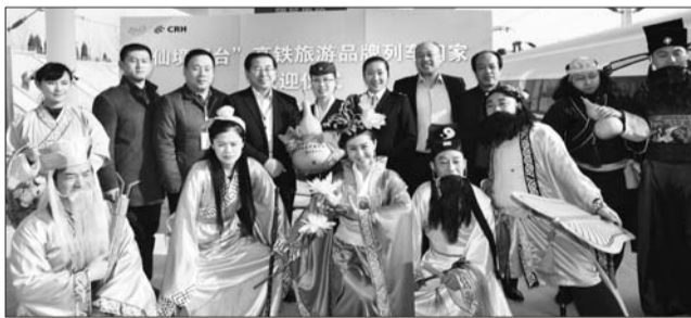
欢迎仪式上,“蓬莱八仙”来助兴。

为了有效带动烟台主要旅游市场,烟台旅游局发动了牟平、海阳、长岛、张裕旅游公司等县市区旅游局、重点旅游企业,分别冠名“养马岛”号、“动感金沙·激情海阳”号、“海上仙山一长岛”号、“百年张裕”号等。形成“一体推介·联合营销”烟台旅游,在创新与互动中激发城市旅游营销的动力与合力,使八方乘客更加直观有效地认知烟台,来烟台旅游。