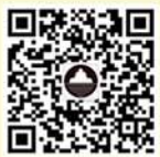
水上古城官方微信

演出时间：2015年1月1日-3日 上午9:30至11:30 下午2:30至4:30