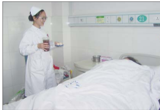
妇产科开展产后免费第一餐。

三是聘请聊城东昌府区妇幼保健院副院长、临清市人民医院护理部主任,分两批对全员开展全院职工医务礼仪的培训,使全体职工切实从思想上转变、从行动上转变,全面提升为民服务理念、服务能力,增强医院竞争实力,使医院整体服务能力有了很大提高。