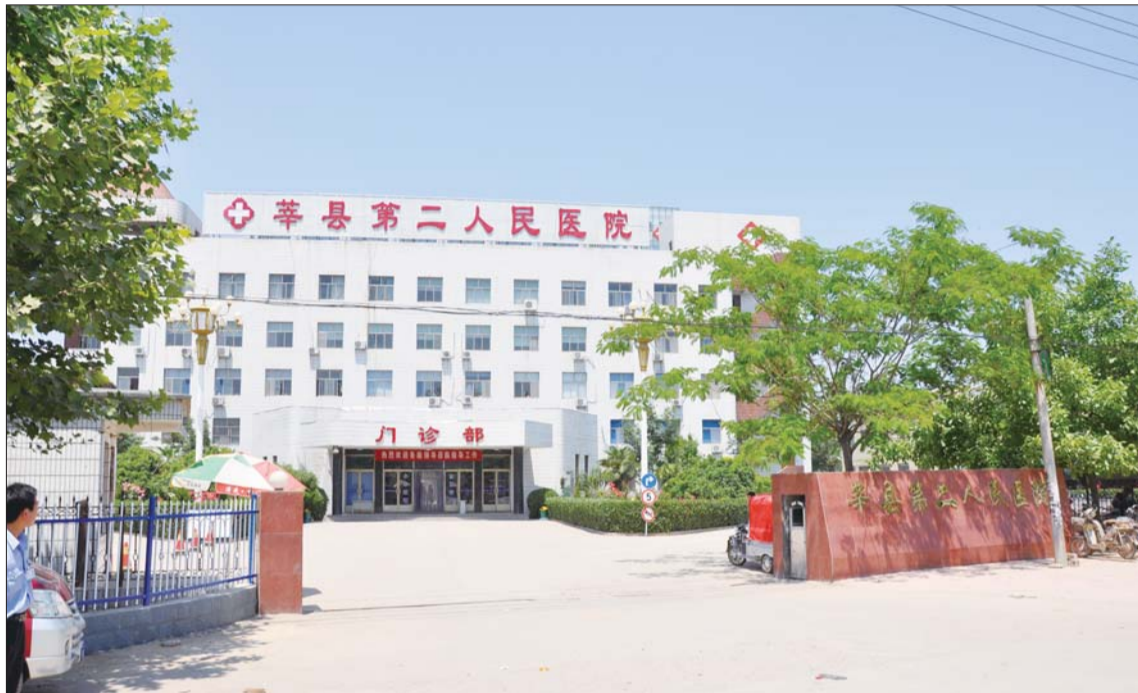
莘县第二人民医院。

莘县第二人民医院,位于莘县朝城镇齐南路,医院始建于1949年,占地面积4.5万平方米,建筑面积3.5万平方米。现有干部职工470人,开放床位500张,年门诊量十万余人次,住院2.5万余人次,设有临床医技科室30余个,拥有国内外先进设备50余台件,总价值3500余万元。同时拥有百级净化手术室1间、万级净化手术室5间、十万级层流净化手术室正负压1间,其配置达到卫计委颁布标准,形成了以心内科、神经内科、普外、骨外、肿瘤、泌尿外、妇产科、手术室、口腔科等一批技术品牌科室,实现了医疗技术水平的重大突破,现已成为莘县中、南部的医疗中心。