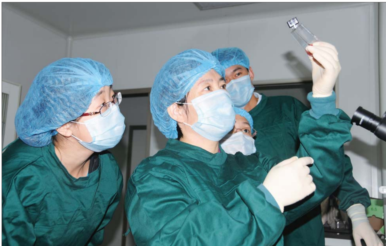
2013年1月13日首次在细胞实验室分离出活病毒。

市疾控中心承担着全市疾病预防与控制、突发公共卫生事件应急处置、疫情及健康相关因素信息管理、健康危害因素监测与控制、实验室检测检验与评价、健康教育与健康促进、技术管理与应用研究指导等工作职责;是全国医药卫生系统先进集体、省级文明单位、聊城市首届十佳文明服务品牌。