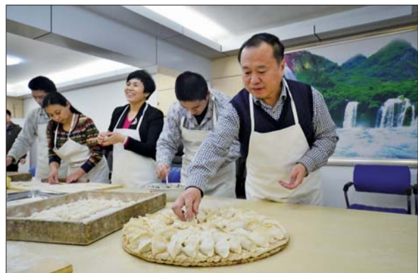
医患和谐,共迎除夕。

患者得不到治疗”。截至目前,在全院享受医疗救助人数达1954余人次,支出医疗救助资金1700余万元;今年,全院积极开展了践行党的群众路线教育活动,每名党员都与一名重性贫困精神疾病患者结成对子,全额救助住院费用,大大缓解了贫困患者经济压力,在社会上产生了巨大影响。