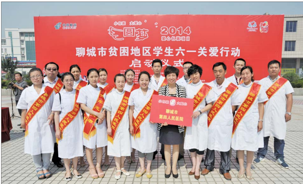
市四院参加团市委组织的“聊城市贫困地区六一关爱行动”并捐款。

几年来,在聊城市委、市政府正确领导下,在省精神卫生中心及聊城市卫计委精心指导下,全院的精神卫生工作紧紧围绕《山东省精神卫生暨重大公共卫生精神疾病防治项目工作会议》精神和聊城市卫计委的工作思路和重点工作目标,全面、扎实地开展各项工作,较好完成了各项工作。