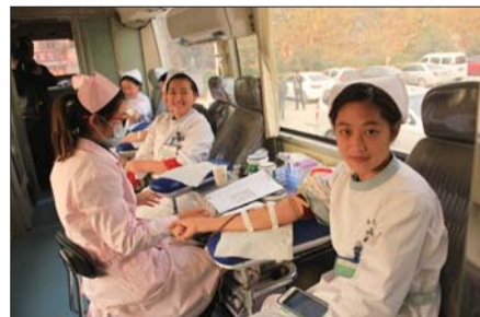
市骨科医院医护人员献血。

增强创新能力,推进血站科研工作。该站血型室已完全具备开展输血技术指导,为聊城各医疗用血单位解决临床用血疑难问题。今年,该站独立开展了三大科研课题,其中一项完成科研鉴定,两项荣获聊城市科技进步奖;成分科自主研发了改进型一次性血浆病毒灭活过滤器,获得国家知识产权局颁布的专利证书。同时,依托聊城市输血质量控制中心,多次组织开展医疗机构输血量(血库)检查督导,对存在的不符合项限期整改,保证了全市临床用血水平持续提升;同时不断提升聊城各级医疗用血单位临床合理用血技术水平。