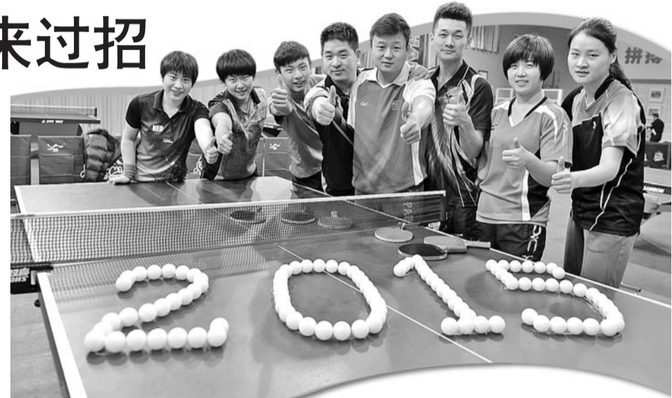
残奥冠军团队迎接挑战。