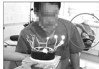
惹祸的韩国整形医生自拍照,背后为正接受手术的病人。

据新华社专电 韩国卫生部门29日说,已经开始调查首尔一家整形诊所的医务人员在手术室玩“自拍”的事件。这家诊所的一名医务人员近日在图片分享网站发布了这些自拍照,引发韩国网民“炮轰”。