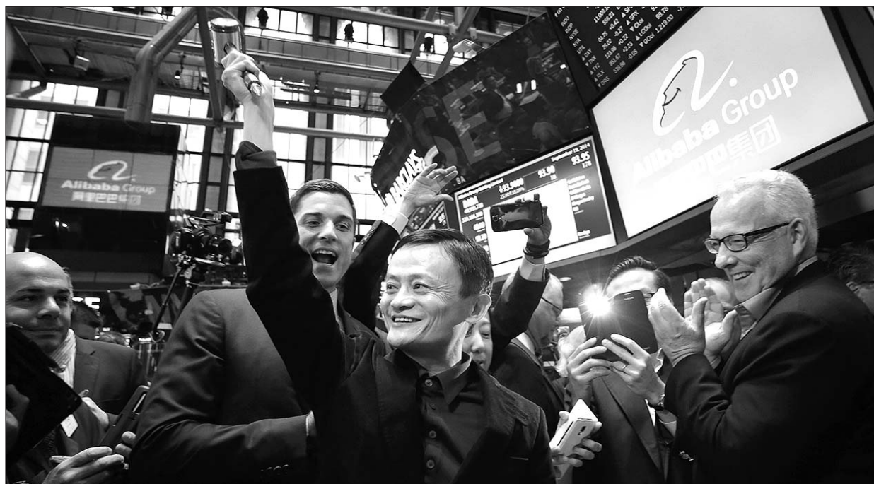
今年9月19日,美国纽约,阿里巴巴集团在纽交所正式挂牌交易,马云在纽交所现场高举敲钟锤。(资料片)