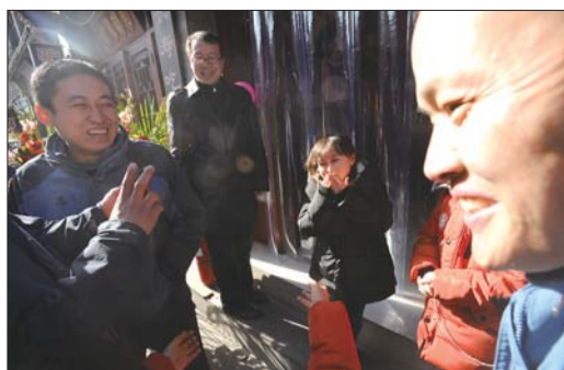
“袖珍妈妈”(右二)的粉丝赶来看望他们的偶像。