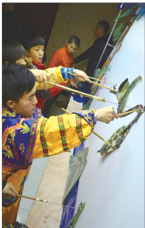
一个简单的动物造型需要多人来完成。