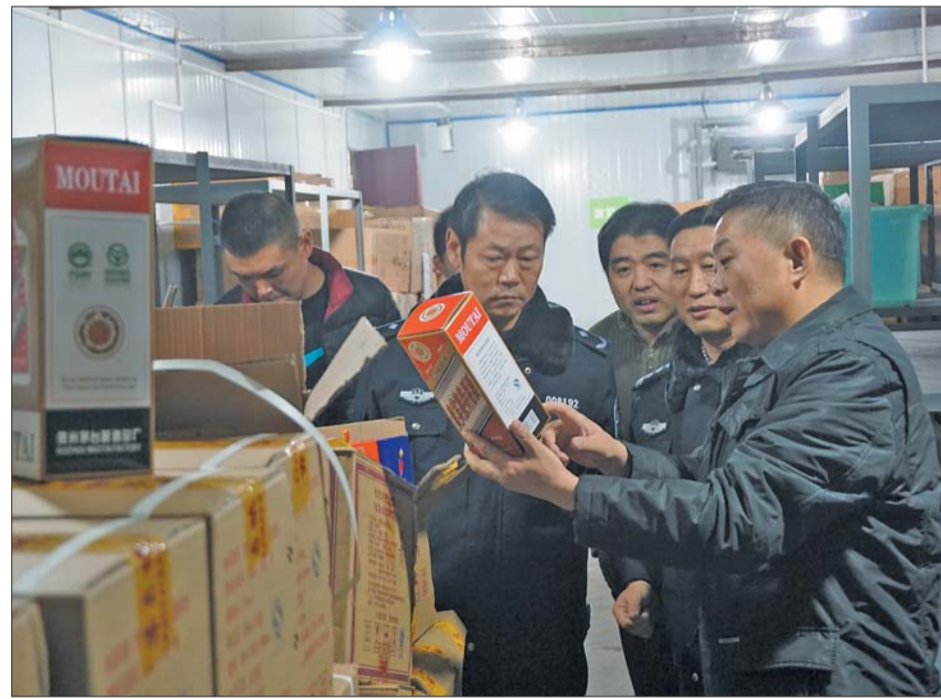
民警查获的大量假冒茅台酒。

警称,嫌疑人一般都是制售各种年份酒,例如5年茅台酒、15年茅台酒。据了解,5年茅台酒一箱六瓶仅298元,15年茅台酒一箱1000多元钱。“买的人都知道是