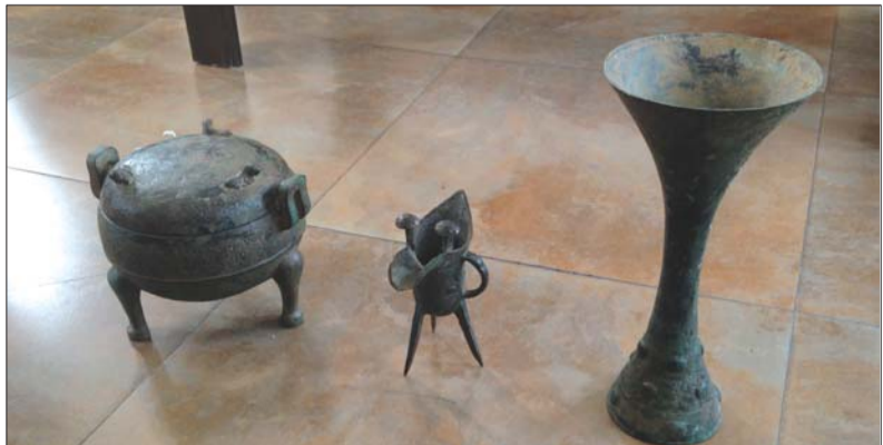
三件涉案青铜器文物。

民警说,即便没有抢劫行为,交易这种贵重的出土文物也是违法行为。现在文物部门和物价部门将对文物价值核实,嫌疑人已经被刑拘。