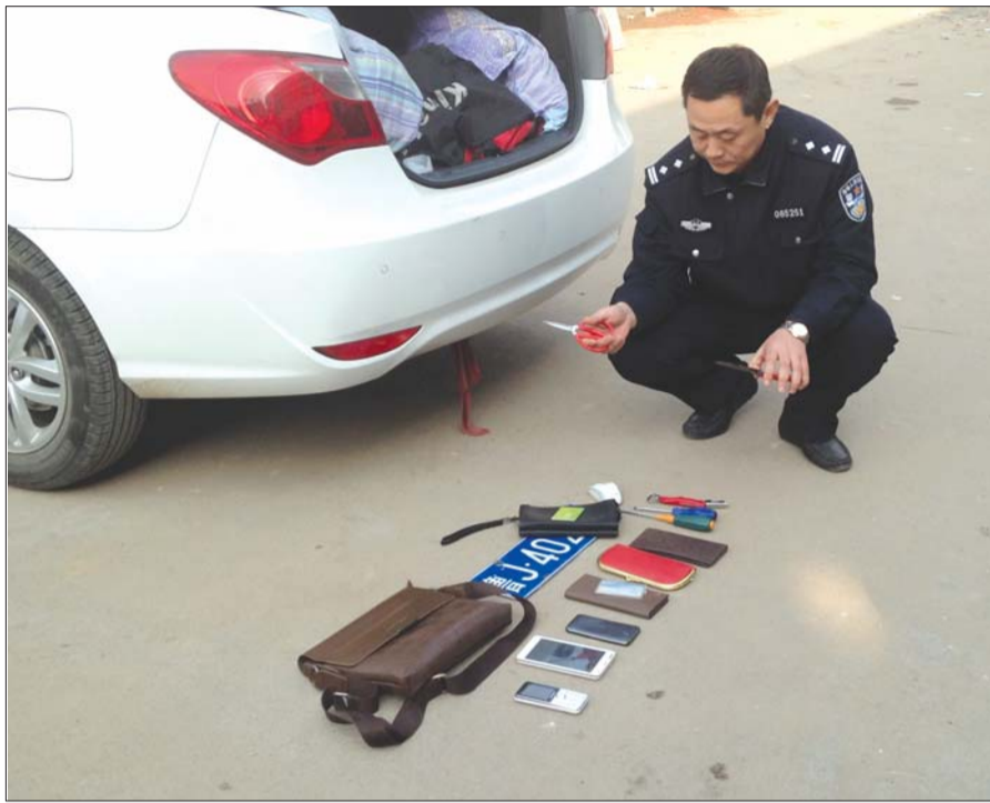
民警对嫌疑车内的物品仔细排查。

得手后,刘某让受害人不要报案,她假装同意。刘某把她拉到肥城郊区一个废弃工厂里。受害人打车回到泰安,到派出所报了案。