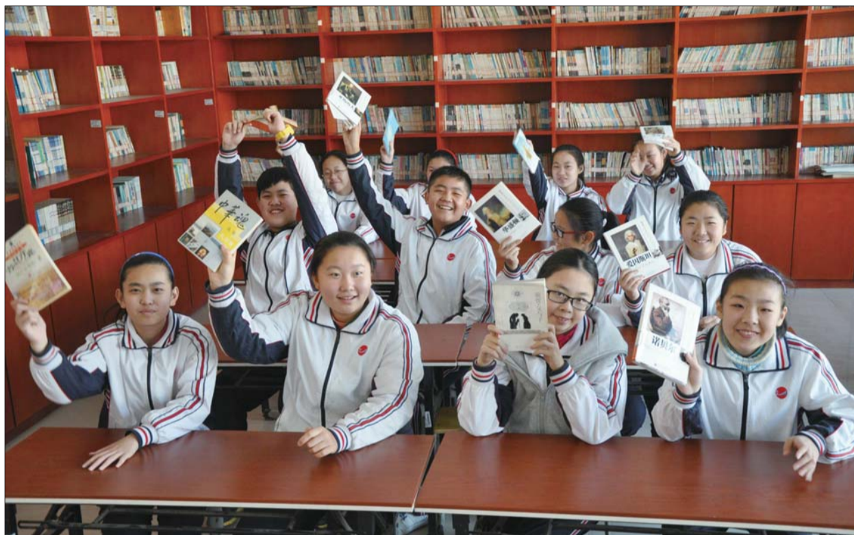
学生们对阅读课很感兴趣。

一位教育专家这样说:“缺乏文化自觉的学校永远沉湎于学校的事务怪圈、技术操作、规章制度、任务完成。”张店二中对“文化自觉”的理解就是,学校要清楚地知道自己在秉承什么,知道自己想要用一种怎样的理念去贯彻到学校的方方面面,去影响全体师生的生活。近年来,学校以“多彩教育”为理念,以构建“书香校园”为载体,致力于“创造适合学生发展的多彩教育”的创设。