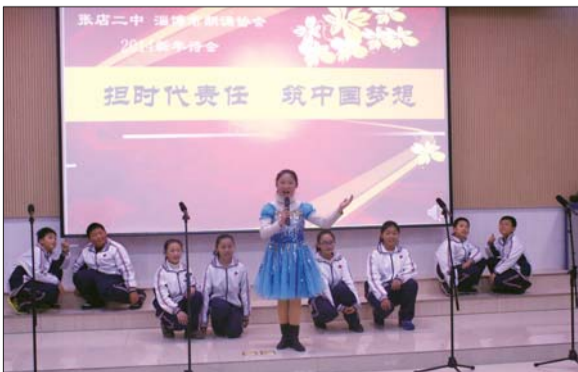
诗歌朗诵。

苏霍姆林斯基曾经说过:“一所学校可能什么都齐全,但如果不是为了人的全面发展和丰富精神生活而必备的书,或者如果大家不喜爱书籍,对书籍冷淡,那么,就不能称其为学校。一所学校也可能缺少很多东西,但在许多方面都很简陋贫乏,但只要有书,有能为我们经常敞开世界之窗的书,那么,这就足以称得上是学校了。”