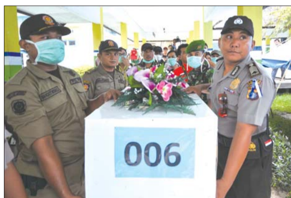
1月1日,工作人员搬运装有打捞起的第6具遇难者遗体的棺材。

管人员要求客机向左偏航7英里并把飞行高度提升至3.4万英尺(10363米)。然而,飞