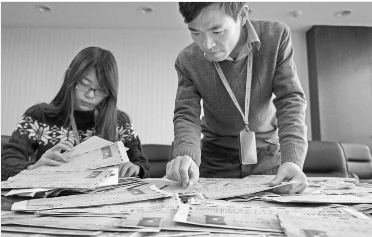
4日,本报记者仔细整理读者寄给本报“时光邮局”的大量信件。