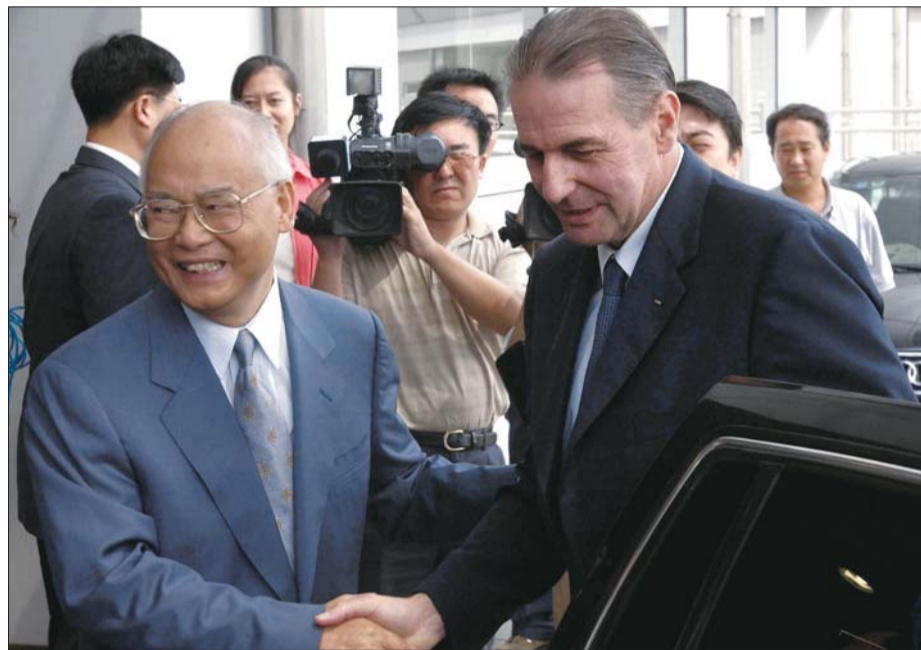
2003年8月31日,何振梁(左)在北京首都国际机场迎接时任国际奥委会主席的罗格。