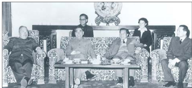
1963年3月周总理会见老挝富马首相,何振梁任翻译。