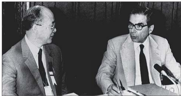
1985年6月5日,何振梁以全票当选为国际奥委会执行委员会委员。图为何振梁(左)同希腊代表菲拉雷托斯交谈。