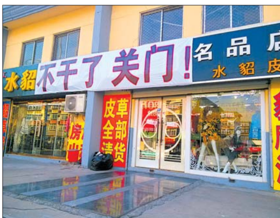
服装店挂起了“不干了 关门!”招牌,但其实还在营业中。

店员说,门口的横幅是昨天才挂上去的,店铺合同到期,即将停业。但对何时停业,店员则模棱两可,先说下周之后就停了,之后又表示过年之前仍正常营业,营业时间为早上九点半至晚上七点。但紧邻的服装店店主则表示,霸气的“关门”招牌挂出来已经有一段时间了。“差不多快一个月了吧!”记者采访的近1个小时中,仅有3人进店选购,并未购买。