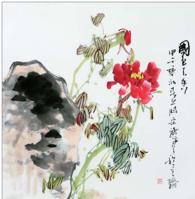
▲国色天香 88×68cm 宋涛