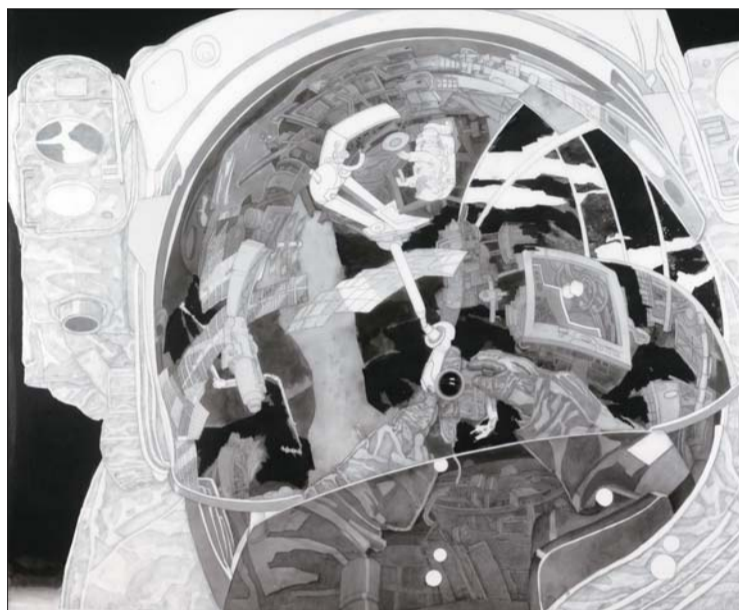
▲瞬间永恒 160×200cm 王利