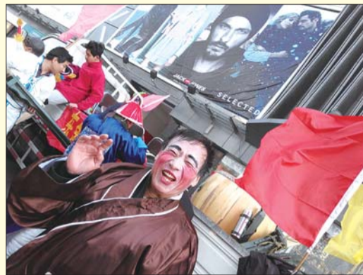
比一比,谁更帅。

投稿方式: (1)扫描“张刚大篷车”二维码,关注“张刚大篷车”微信公众号,在微信中发送您的摄影作品。 (2)将作品发送到qlwbpc@163.com,来稿请注明作品主题、作者、拍摄地点和时间、摄影设备名称等。