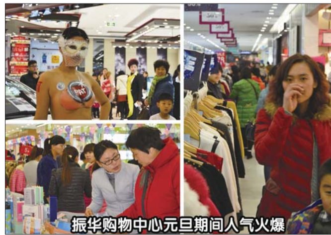
振华购物中心元旦期间人气火爆

本次“2015跨年遇到爱”大型元旦促销活动的胜利收官离不开广大消费者的支持和厚爱,在即将到来的春节期间,我们振华购物中心全体员工会以更饱满的热情,更优质的商品,更贴心的服务,更实惠的价格回馈广大消费者。