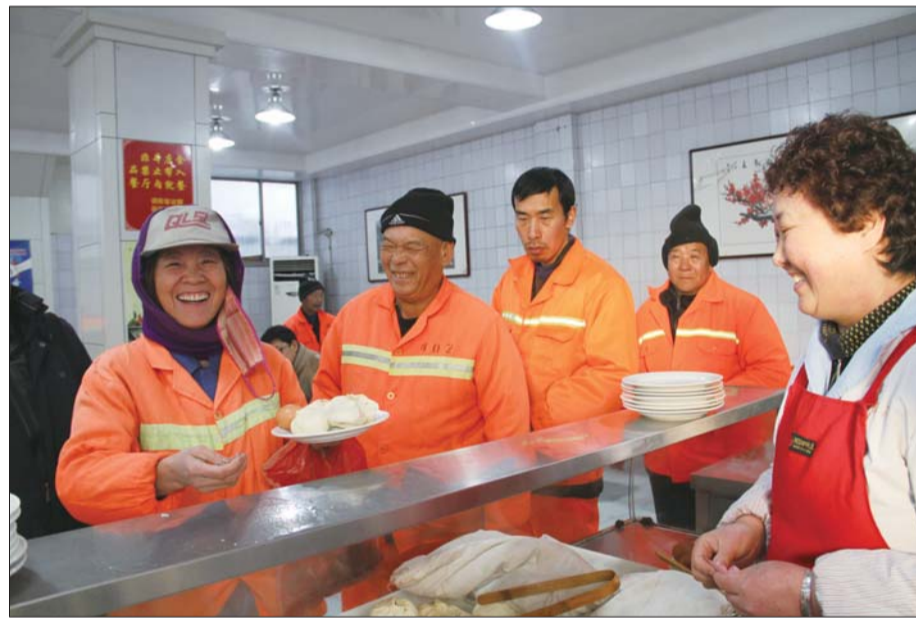
环卫工人正在领取免费早餐。