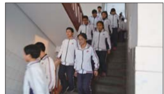
张店七中的学生在课间操时,有秩序地靠右边下楼梯。

市教育局在《关于做好校园安全工作的通知》中强调,各单位要加强安全宣传教育和演练,提高学生自救自护能力,教育学生主动离开不安全地点,远离社会危险人群,如遇到突发事件,要沉着冷静,学会自我保护与规避风险,努力提高学生的应急防范意识和自救自护能力,最大限度地减少因人为伤害和自然灾害造成的人员伤亡。