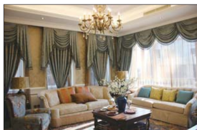
▲样板间内的会客厅。