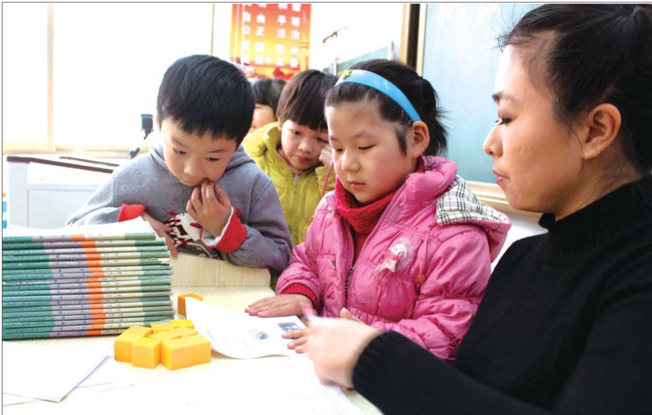
23日下午,济南市十亩园小学一年级3班的学生在进行数学口语测试。