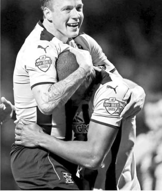
剑桥联赛后庆祝难得的平局。

因此，我们梦想国足打进世界杯，甚至有朝一日捧得冠军，但更别忘了中国的剑桥联们——我们更应期待，当“海定联队”、“番禺联队”等草根球队能和北京队、广州队同场竞技，一决高下时，中国人共同的足球梦想或许已非遥不可及。