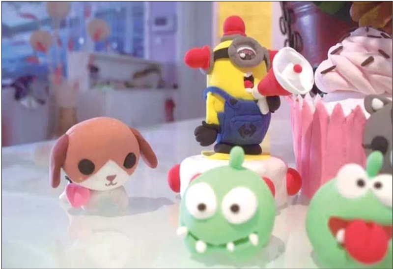
山师东路社区 佳佳小朋友