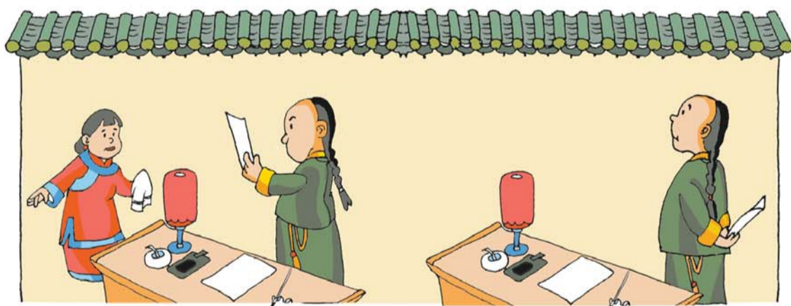
清代开国状元傅以渐, 在京城为秘书院大学士, 家中因为定基纠纷, 修书一封, 希望他能家中撑腰。