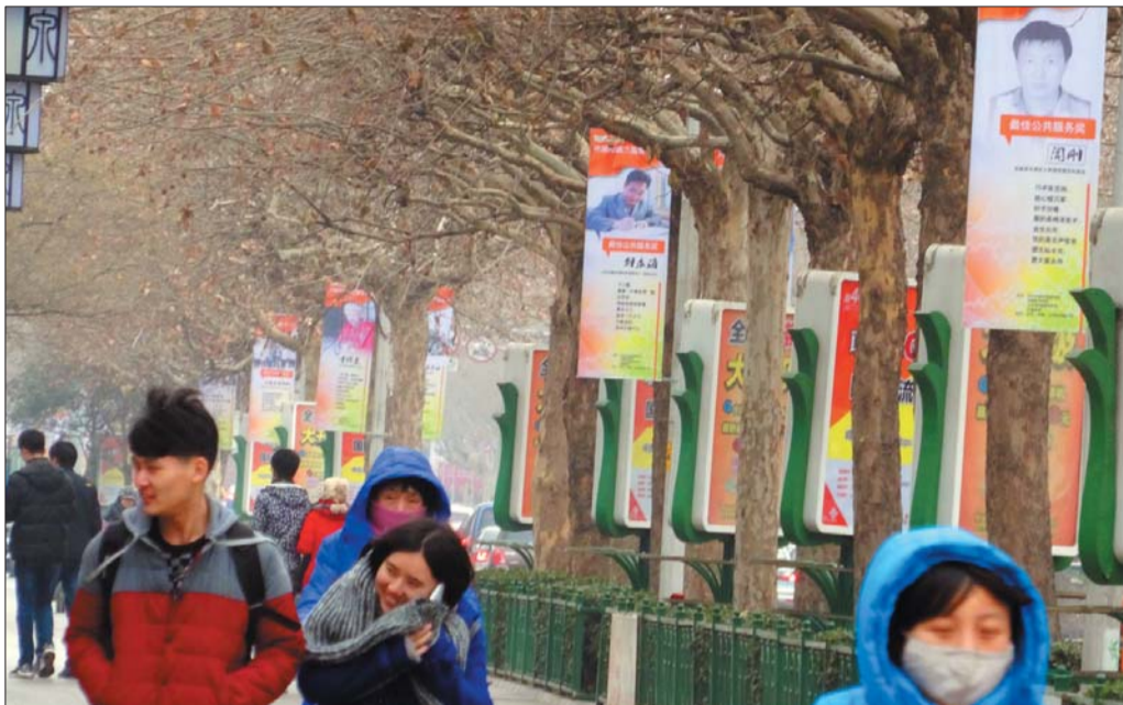
21日,第三届责任市民海报亮相泉城路。本报记者 左庆 摄

本报讯(记者 许建立) 小人物,大担当。2015年1月22日上午,济南市第三届责任市民暨最佳公共服务奖颁奖典礼在山东新闻大厦举行。评选启动以来,很多市民参与到评选活动中,最终评出21名获奖者,他们的事迹深深感染了每一个人。历山路社区党总支书记、居委会主任董继红获得最佳公共服务提名奖。