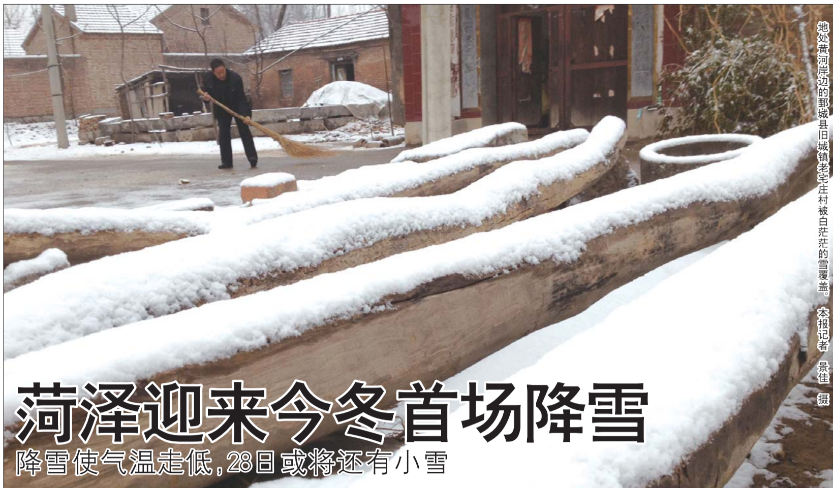
地处黄河岸边的鄄城县旧城镇老宅庄村被白茫茫的雪覆盖。