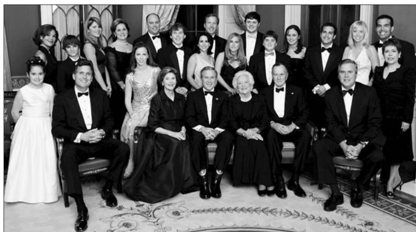
美国政治世家布什家族的全家福。

上述种种事实在全世界都很普遍,不过这种趋势在美国表现得最为明显。这部分是因为美国的贫富差距在富裕国家中是最大的。奥巴马在1月20日的国情咨文中也曾反复提及这一问题。美国的教育体系在富裕国家中是最倾向于富人的。由于教育经费主要由地方出资,美国是仅有的政府对富裕地区的教育投入多于贫穷地区的3个发达国家之一。自1980年以来,美国大学学费一直在上涨,速度是收入中位数上涨速度的17倍。与此同时,许多大学还为成功的校友们提供特殊待遇,在招生中优先录取校友的后代。