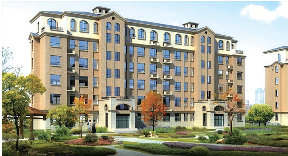
康和新城君林多层洋房效果图。

城发·康和新城为芝罘区百万平方米生态景观大盘,已入住近2000户业主,社区纯熟,配套完善;临近鼎城小学、芝水小学、烟台六中、烟台十四中等教育机构,目前社区配套幼儿园“蓝天康和幼儿园”已开园营业;项目距鲁东大学商圈、南大街商圈、三站商圈等主流商圈仅15-20分钟车程,繁华近在咫尺;社区周边环绕着全系生活配套,如振华量贩超市、家家悦超市、芝水农贸市场、农业银行、107医院等,为业主带来全系完美生活。