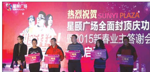
答谢会现场热闹非凡,许多业主获得奖品。

“新春感恩特惠季”浓情启幕:2015年2月28日前,认购75-105平方米星颐华府,就有机会获赠