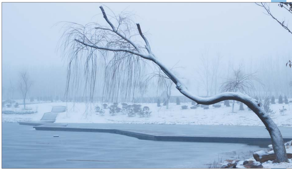
偶尔吹落的积雪,使得树与湖面有了更深的接触。