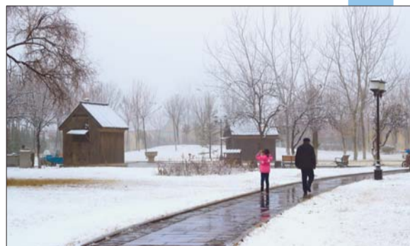
早起的人们记录着此刻的风景,其实在别人眼中,你也是一道靓丽的风景。