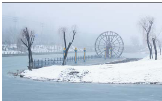
结冰的河面,停止的水车,下雪后的早晨更多的是寂静。