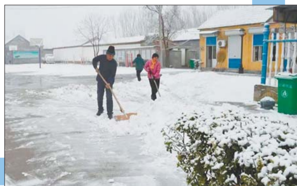
沙河乡刁家村的村民在打扫着小广场的积雪,这一刻团结就是力量。