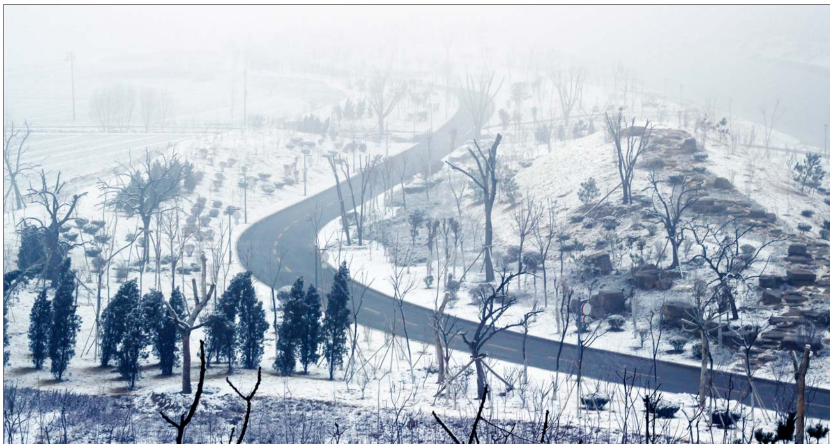
远远望去,蜿蜒的公路,白雪覆盖的麦田,还有两旁耸立的青松,这样美的商河,让我怎能不爱你。