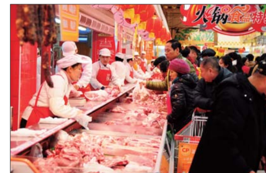
市民在超市选购新鲜猪肉。

在食品价格中,粮食价格上涨3.5%,鲜蛋价格上涨11.1%,液体乳及乳制品价格上涨17.7%,油脂价格下降2.4%,猪肉价格下降4.9%,鲜菜价格下降13.1%。工业品价格持续低迷。全年工业生产者出厂价格(PPPI)下降1.8%,工业生产者购进价格(PPI)下降3.6%,已连续27个月同比双下降。