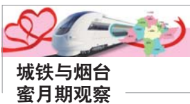
城铁与烟台 蜜月期观察

本报1月29日讯(记者 蒋大伟) 目前,青荣城铁已开通运行一个月,烟台市民也渐渐熟悉了乘动车出行的方式。但也有部分市民反映,从烟台坐动车出省可以选择的直达车次较少,不少身在烟台的省外人士春节想坐动车回家挺不容易。