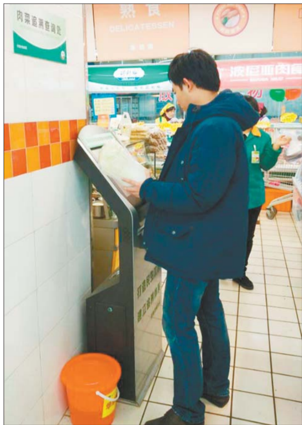
一市民在省城一家超市查询白菜的来源。