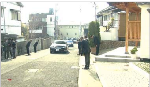
▶1月25日,山口组在神户总部举行纪念活动。