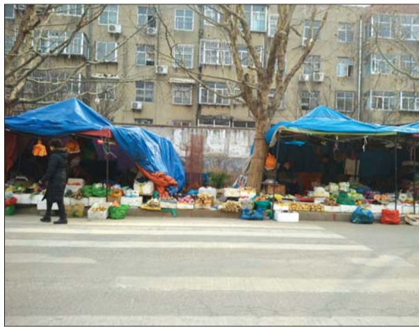
文化路的商贩路边搭起帐篷。

记者又走访科山路,迎春路、南湖大街、通天街、泰东路汽车城、乐园小区等多个路段,发现马路市场反弹普遍,一旦无人管理,街面马上陷入乱摆摊混乱。