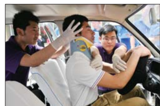
淄博急救指挥中心进行车内急救比武(资料片)。

据工作人员介绍,以“外伤出血”和“心绞痛”为例,外伤出血时若伤口处有玻璃片、小刀等异物插入时,千万不要触动和拔出。可保留异物,在伤口边缘将异物固定。可采用加压包扎止血,先用干净的较厚的纱布覆盖伤口,用手直接在敷料上施压。对嵌有异物的伤口不能直接压迫止血。大出血者加压包扎的同时拨打120及时送往医院;心绞痛时要让病人保持安静,不要用力,揭开病人的衣领、皮带纽扣等,注意保暖。有条件的立即给病人吸氧,含服速效救心丸或消心痛等药物。呼吸心搏停止者,立即进行心肺复苏。