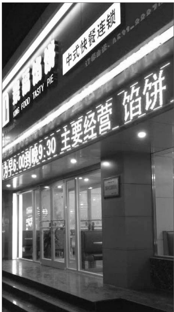
原址位于佛山街28号的统领KTV去年关门,如今已经成了一家馅饼店。