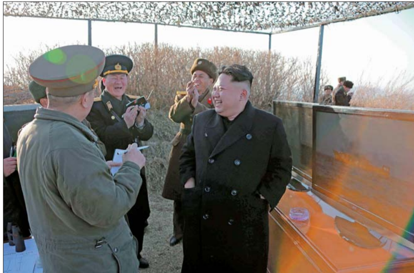
朝中社7日报道,朝鲜最高领导人金正恩观看了人民军新型反舰火箭发射试验。 新华/朝中

然而,朝韩在诸多问题上存在严重分歧,领导人对话能否举行仍然存在很大变数。朝中社上月报道,朝鲜“实践6·15共同宣言”北方委员会发言人强调,停止韩美军演是改善北南关系的先决条件。发言人说,实现自主统一的根本关键在于消除半岛战争危险,创造和平环境,加强北南对话协商和交流,而改善北南关系的先决条件是韩国当局抛弃“体制统一论”和停止与外部势力联合举行大规模军演。