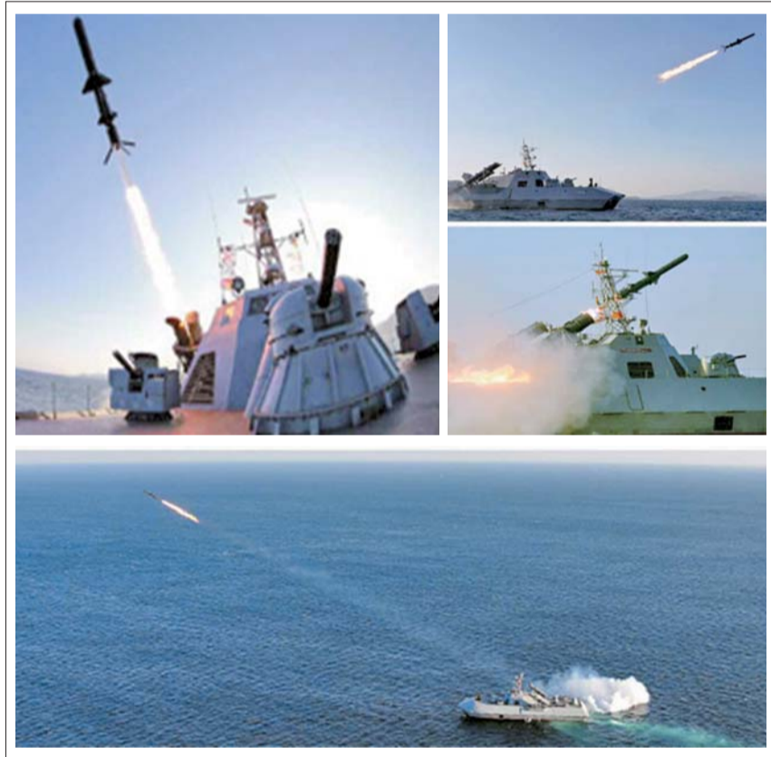
朝鲜人民军海军舰艇日前进行新型反舰火箭发射试验。 据劳动新闻