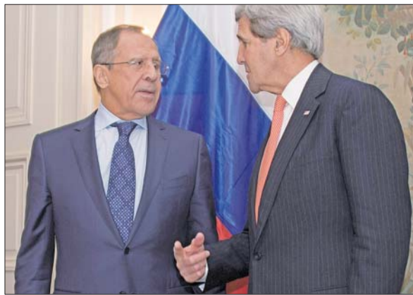
7日,在德国慕尼黑,俄罗斯外长拉夫罗夫(左)和美国国务卿克里谈及乌克兰危机。

克兰、欧洲安全与合作组织、俄罗斯)同乌克兰东部民间武装代表去年9月5日在白俄罗斯首都明斯克达成的停火协议。随后,三方联络小组同乌克兰东部民间武装代表签署备忘