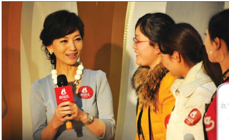
▲赵雅芝和粉丝互动。▶赵雅芝为读者送祝福。

接受本报记者专访后,赵雅芝写下“祝齐鲁晚报·今日运河的读者新年新气象!”,恭祝本报读者及广大济宁市民新春愉快。