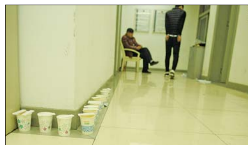
千佛山派出所讯问室外摆放着相关嫌疑人的尿检样本。