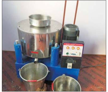
⑤对压榨的特级花生油进行离心脱磷灌装。