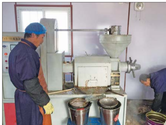
③对筛选出的特级花生进行压榨过滤。