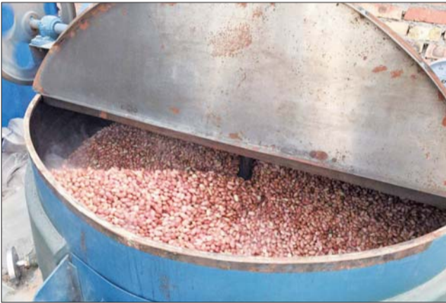
②第二步,对筛选出的特级花生进行炒制。