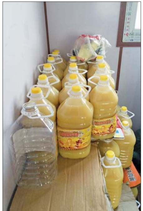
④对压榨的特级花生油进行沉淀后灌装。