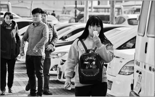
14日济南气温达到19.1℃，街头一位女孩吃起了冰激凌。