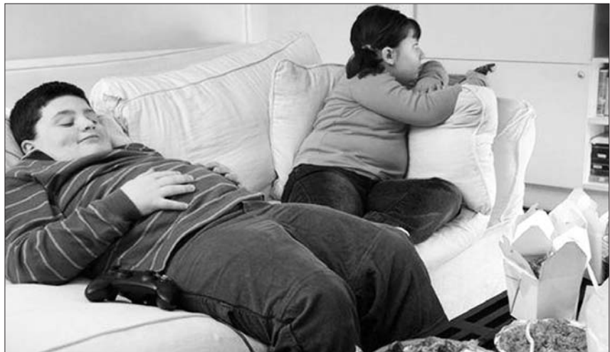
寒冷而萧条的英国北部,不良的生活习惯让大批英国人成了“沙发土豆”。

但一些分析人士批评,英政府此举主要为了节省财政开支,而且涉嫌对民众日常生活“管得过宽”。