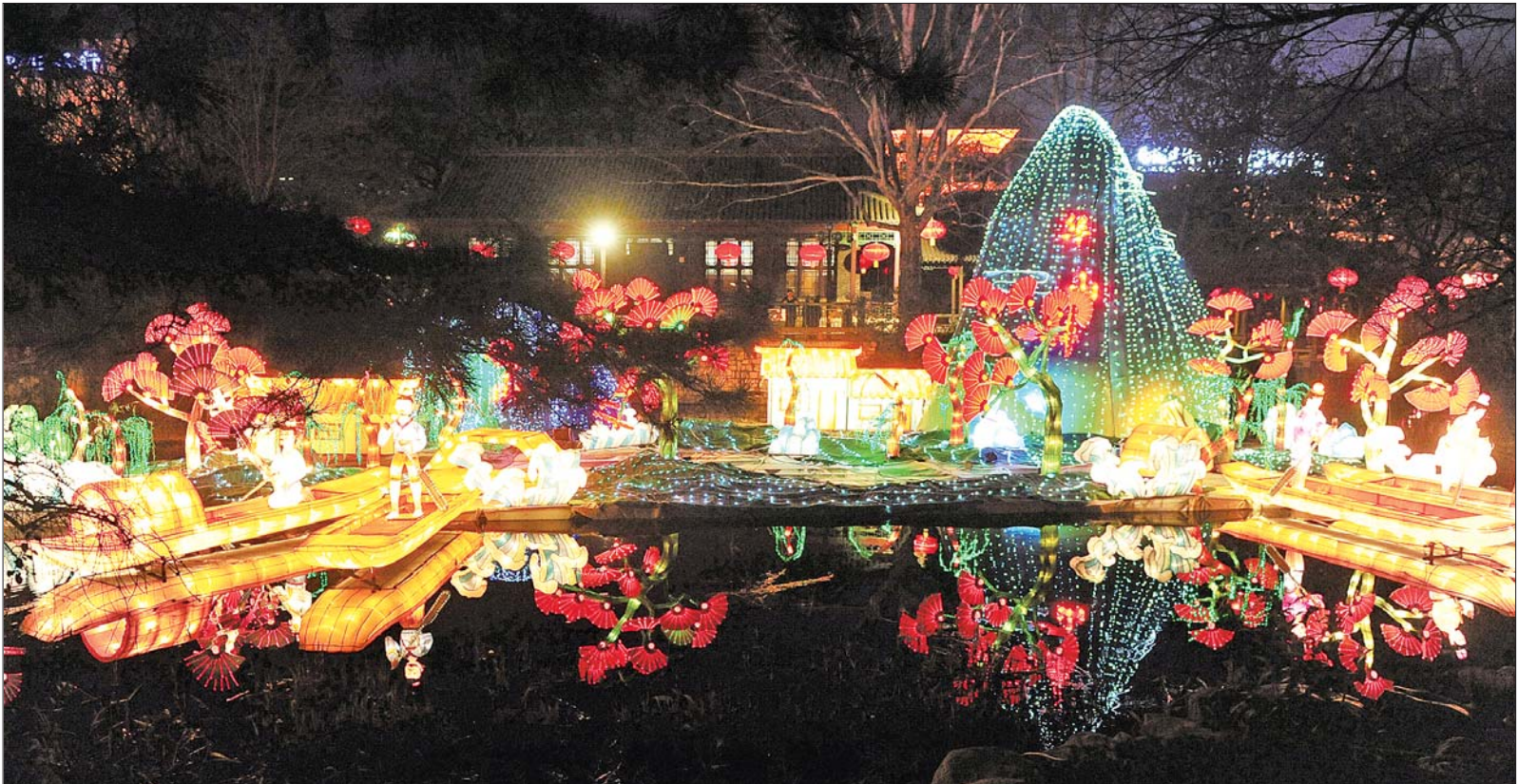
最长的鹊华秋色图组灯。