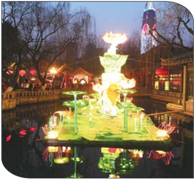
富有济南特色的花灯。

民面前，也是煞费苦心。陡峭耸立的华山和低矮侧卧的鹊山左右映衬，惟妙惟肖，不少游客已经迫不及待地想要一饱眼福了。 而趵突泉北广场上的喜羊羊主题花灯则引来了不少小朋友，工作人员在打开开关进行调试时，喜羊羊的四肢、脑袋还会转动。本届灯会与往届相比，除了制作工艺更加精细逼真、生动形象外，多数灯组都能够“自如活动”，如鞠躬、旋转、打鼓。