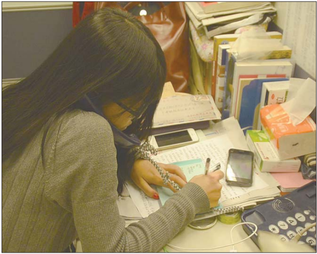
本报见习记者王晓莹负责与参与时光邮局活动的读者电话沟通并采访写稿。