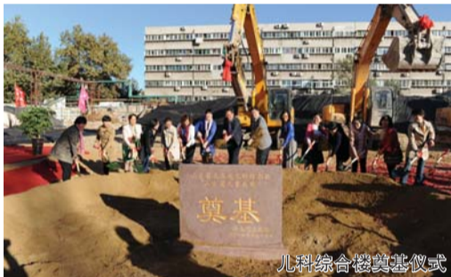
儿科综合楼奠基仪式

儿科综合楼奠基、省立口腔医院改造启动、手术室一期改造完毕等,医院建设和规划规模大力提升