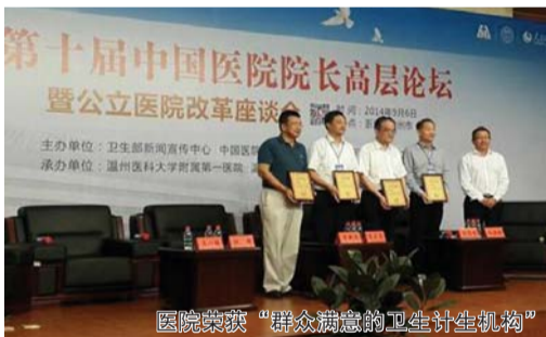
医院荣获“群众满意的卫生计生机构”

2014年11月1日,由复旦大学医院管理研究所牵头研制的2013年度中国最佳医院排行榜正式发布。山东省立医院位列榜单第60名。课题立项199项;SCI收录论文240篇;新获批专利50项,专利数量为全国医疗机构排名20位。