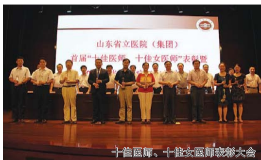
十佳医师、十佳女医师表彰大会

2014年医院评出首届“十佳医师”和首届“十佳女医师”,以及第二届“十佳青年医师”。